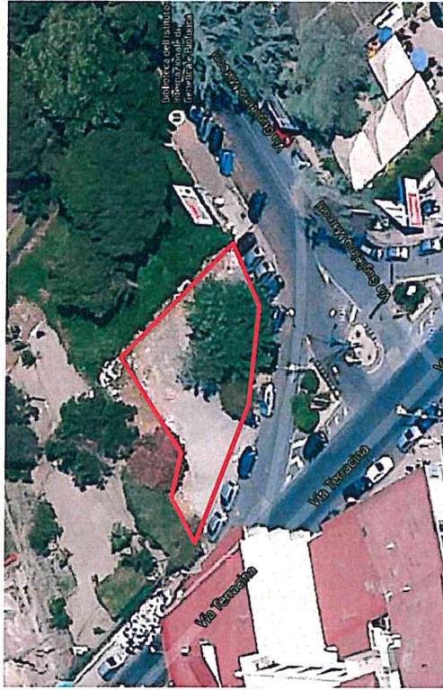
Planimetria scala 1/500